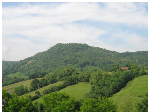
Paisaje que combina la textura fina de los prados con la de grano grueso correspondiente a los bosques. Autor: Miren Askasibar

Para entender el concepto de textura se puede comparar la imagen de una playa de arena fina y otra pedregosa; la textura de la primera será fina, y la de la segunda gruesa. El paisaje tiene textura; por ejemplo, un prado tendrá textura fina en comparación con una plantación de frutales.